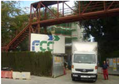
IQS (INSTITUTO QUÍMICO DE SARRIÁ) (FCC)