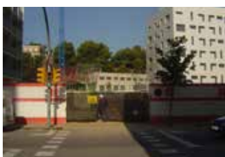
TORRE BARO (ACSA)