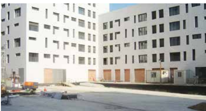
TORRE MIRONA (ACSA)