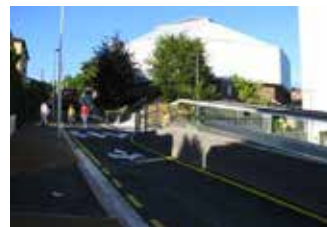
ACCESIBILIDAD VERTICAL EN INTXAURRONDO (S. SEBASTIAN)