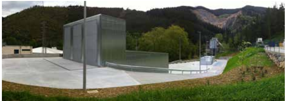
ELGOIBAR PUNTO VERDE