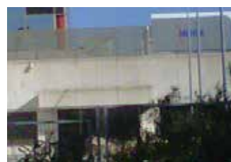
NAVES LABORATORIOS MERCK (BANASA)