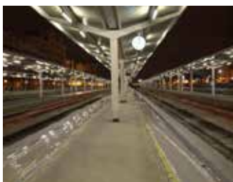
ANDEN DE LA ESTACIÓN DE RENFE DE VALENCIA