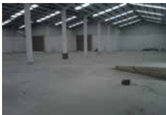
NAVES INDUSTRIALES IRURENA EN HERNANI